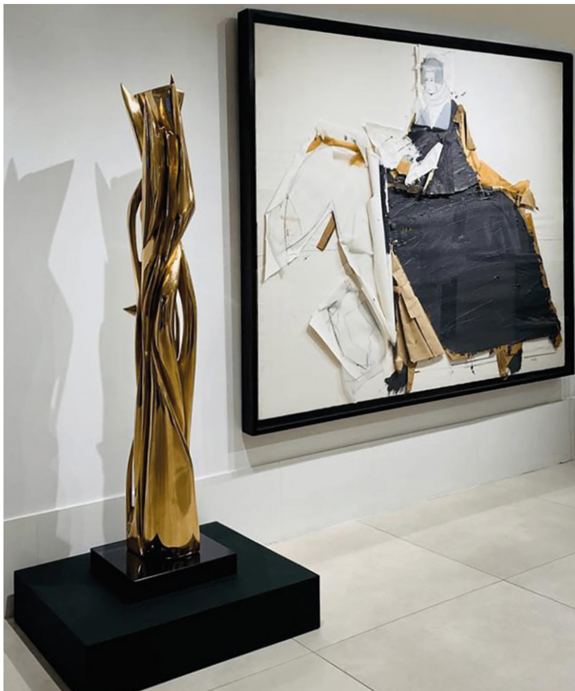
Galleria d'Arte Contini, opere di Pablo Atchugarry e Manolo Valdés